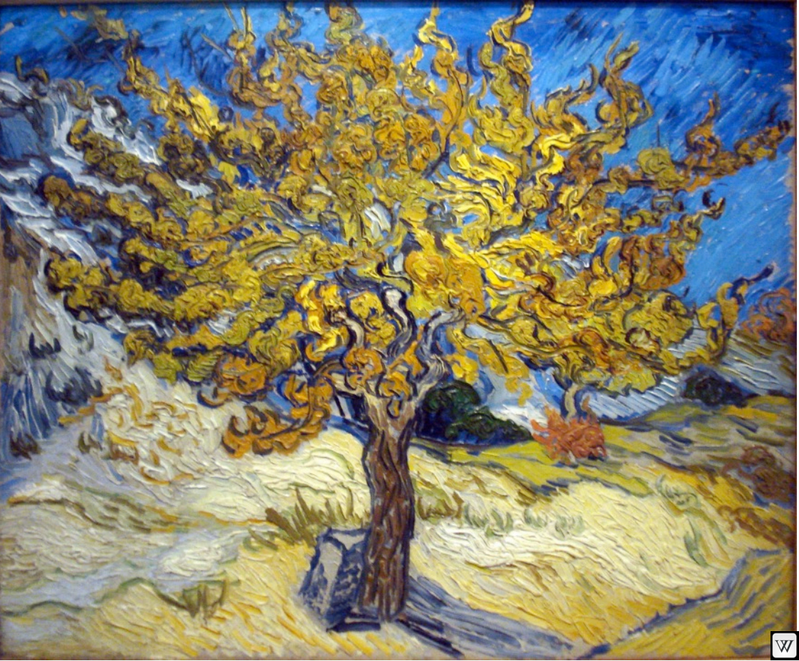
Vincent van Gogh: The Mulberry Tree, 1889

https://commons.wikimedia.org/wiki/File:The_Mulberry_Tree_by_Vincent_van_Gogh.jpg